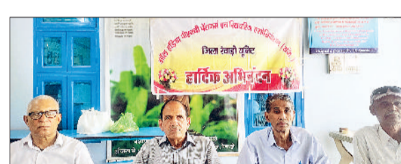
रेवाड़ी। बैठक में उपस्थित एसोसिएशन के पदाधिकारी।