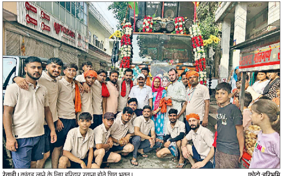
रेवाड़ी। कांवड़ लाने के लिए हरिद्वार रवाना होते शिव भक्त।