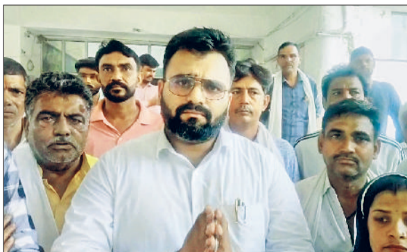
रेवाड़ी। गांव में दशकों पूर्व बनाया गया बांध, बांध के दूसरी ओर एकत्रित पानी तथा डीसी से मिलने पहुंचे ग्रामीण।

बांध टूटने का खतरा जमीन खाली कराने के लिए 18 जुलाई का समय निर्धारित किया हुआ है। ग्रामीणों ने डीसी को बताया कि यह बांध पूरे गांव को जलभराव से बचाता है। अगर बांध तोड़ा जाता