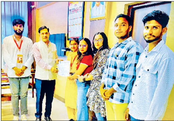
रेवाड़ी। कुलसचिव को ज्ञापन सौंपते हुए एबीवीपी कार्यकर्ता।

इंदिरा गांधी विश्वविद्यालय मीरपुर परिसर में अखिल भारतीय विद्यार्थी परिषद इकाई की ओर से नवागंतुक छात्रों की सहायता के लिए हेल्प डेस्क लगाई गई। हेल्प डेस्क के माध्यम से छात्रों को प्रवेश प्रक्रिया, विषय चयन, दस्तावेज सत्यापन, छात्रवृत्ति आवेदन और अन्य प्रशासनिक प्रक्रियाओं में सहायता प्रदान की गई। इस अवसर पर एबीवीपी कार्यकर्ताओं ने विश्वविद्यालय के कुलसचिव को एक 11 सूत्रीय मांग पत्र भी सौंपा, जिसमें छात्र हितों से जुड़ी अनेक