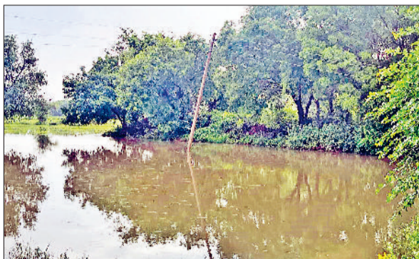
रेवाड़ी। गांव में दशकों पूर्व बनाया गया बांध, बांध के दूसरी ओर एकत्रित पानी तथा डीसी से मिलने पहुंचे ग्रामीण।

कोर्ट की ओर से जमीन मालिक के पक्ष में फैसला देने के बाद उसे कब्जा दिलाने के आदेश प्रशासन को जारी किए जा चुके हैं। जैसे ही ग्रामीणों को कोर्ट के आदेशों के बारे में पता चला, पूरे गांव की इससे नीड उड़ चुकी है। प्रशासन की ओर से