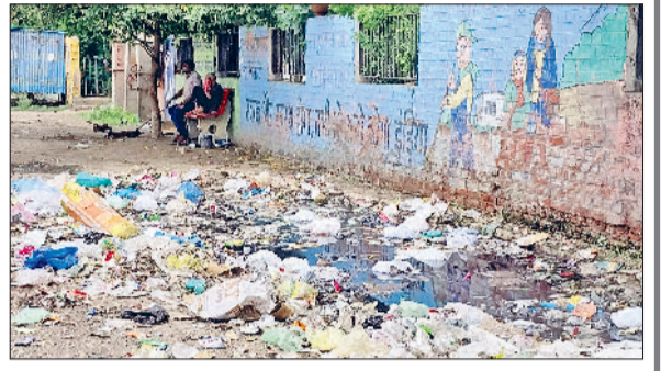
रेवाड़ी। राव तुलाराम पार्क स्थित सार्वजनिक शौचालय के पास जमा गंदी पानी, सचिवालय रोड पर लगा गंदगी का ढेर, भाड़ावास रोड पर बनी स्वच्छता पॉइंट के पास जमा गंदगी।

फिसलकर 637 पर पहुंच गया है। बावल की स्टेट रैंकिंग 77 व धारुहेड़ा की 44 आई है। ओडीएफ स्टेटस में बावल नगरपालिका को ओडीएफ व धारुहेड़ा को वाटर प्लस मिला है। स्वच्छता रैंकिंग में पिछड़ने के रहे यह कारण नगर परिषद की ओर से शहर को स्वच्छ बनाने के लिए भी ठोस कदम नहीं उठाए गए। शहर में एक भी जगह डस्टबिन नहीं है। सभी मार्गों पर जगह-जगह अनावश्यक कचरा प्वाइंट बन गए हैं, जहां हर समय गंदगी फैली रहती है। सफाई कर्मियों की कमी भी शहर की सबसे बड़ी समस्या है। शहर में वर्तमान में