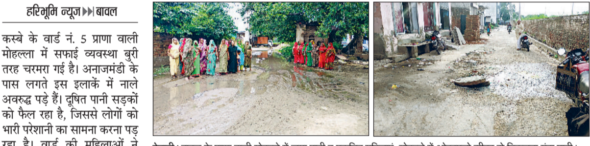
रेवाड़ी। बावल के प्राणा वाली मोहल्ले में जमा पानी व एकत्रित मलियाएँ, मोहल्ले में ओवरफ्लो सीवर से निकलता गंदा पानी।