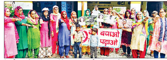
रेवाड़ी। कार्यक्रम में शपथ लेते हुए आंगनवाड़ी वर्कर व महिलाएं।

कि बरसात का सीजन शुरू होने के बाद बांध के दूसरी ओर भारी मात्रा में पानी भरा हुआ है। बांध टूटने ही यह पानी गांव में लोगों के घरों तक प्रवेश कर जाएगा, जिस कारण इस बांध को टूटने से बचना जरूरी है। ग्रामीणों ने बताया