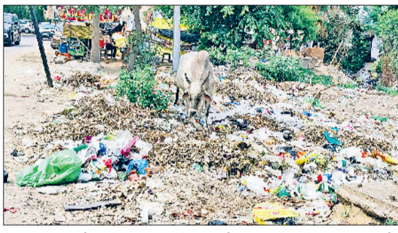
रेवाड़ी। राव तुलाराम पार्क स्थित सार्वजनिक शौचालय के पास जमा गंदी पानी, सचिवालय रोड पर लगा गंदगी का ढेर, भाड़ावास रोड पर बनी स्वच्छता पॉइंट के पास जमा गंदगी।

नंबर पर आ गया है। ओडीएफ स्टेटस व राष्ट्रीय स्तर पर स्वच्छता रैंकिंग में जिले के पिछड़ने का कारण नगर परिषद के सफाई के उचित प्रबंधन का अभाव, लोगों में जागरूकता की कमी और शहर में डस्टबिन हटने से अनावश्यक कचरा प्वाइंट का बनना है। इसके अलावा डोर-टू-डोर कचरा प्रबंधन का टैंडर लेने वाले ठेकेदार की लापरवाही व समय पर कचरे का निस्तारण करने में लापरवाही बरतना है। बावल व धारुहेड़ा में स्वच्छता रैंकिंग में जिला काफी पिछड़ गया है। स्वच्छता सर्वेक्षण-2023 में बावल की 246 रैंकिंग गिरकर 1271 पर आ गई है, जबकि धारुहेड़ा 186 रैंकिंग से