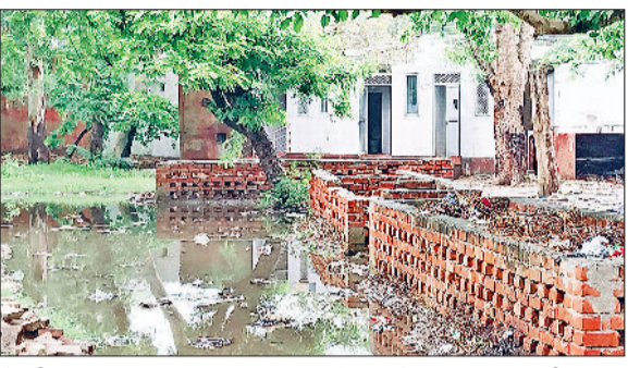
रेवाड़ी। राव तुलाराम पार्क स्थित सार्वजनिक शौचालय के पास जमा गंदी पानी, सचिवालय रोड पर लगा गंदगी का ढेर, भाड़ावास रोड पर बनी स्वच्छता पॉइंट के पास जमा गंदगी।

शहरी एवं आवास मंत्रालय की ओर से जारी किए गए स्वच्छता सर्वेक्षण 2024-25 के रिजल्ट में जिले को ओडीएफ स्टेटस और नेशनल रैंकिंग में जोरदार झटका लग गया है। जिले की स्वच्छता रैंकिंग ने प्रशासन को आईना दिखा दिया है। शहर में लंबे समय से बिगड़ रही सफाई व्यवस्था ने शहर को स्वच्छता रैंकिंग में 2023 के स्वच्छता सर्वेक्षण की रैंकिंग से 232 पायदान नीचे गिरा दिया है। स्वच्छता सर्वेक्षण-2023 में जिले को ओडीएफ डबल प्लस मिला था जोकि स्वच्छता सर्वेक्षण-2024-25 में सिर्फ ओडीएफ रह गया है। इसके अलावा रेवाड़ी की स्वच्छता सर्वेक्षण-2023 में राष्ट्रीय स्तर पर 258वां स्थान मिला था, जबकि इस बार जिले की रैंकिंग गिरकर 490 पायदान पर आ पहुंची है। स्टेट में 11वें नंबर पर रहने वाला रेवाड़ी जिला 57